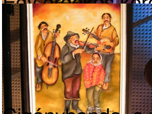
...Cigánybanda, a vidámság ritka pillanatai