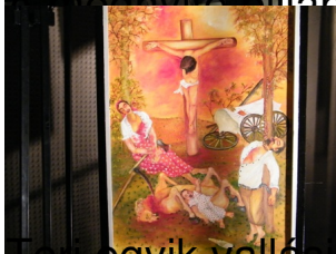
...viki vállfű ihletésű képe