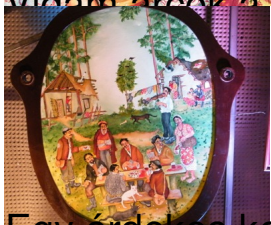
...Egy érdekes körbe foglalt falusi idill