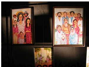
...k, hagyományos viseletben