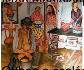
...Otthon a család