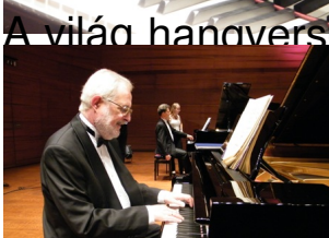
A világ hanoveri versenytermei közül többen megirigyelnék a hangszer