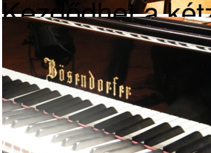
Kezdi a kétzongorás mű próbája