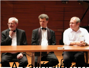
A zongorapárbaj vezető résztvevői