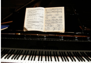
Előttük az egyik csodálatos hangszer