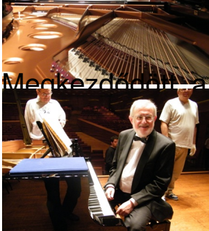
Megkezdődött a hangszeres és az ujjak bemelegítése