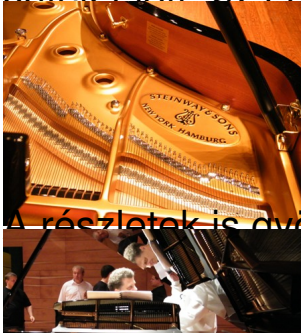
A részletek is gyönyörűek