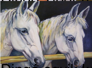
Dingó egyik kedvenc témája: lovak