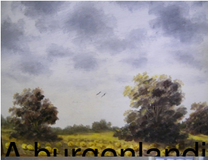
A burgenlandi táj