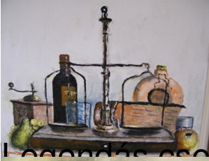
Legendás eseményeinek egyike