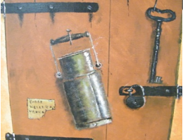
Gerencsér egyik letisztult munkája