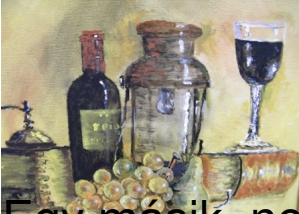
Egy másik, nem kevésbé szép munkája