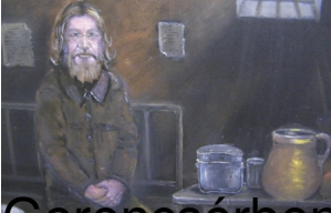
Gerencsérben is mély nyomot hagytak a börtönévek