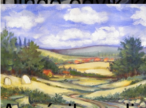
A másik pedig a táj