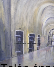
Talán éppen az egykori pécsi börtön folyosóját látjuk