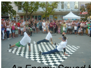
Az Enemy Squad breakesei szórakoztatták a nagyérdeműt a placcon