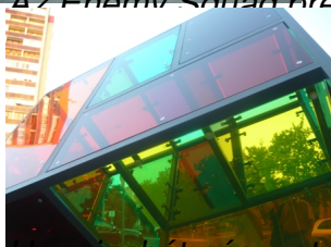
Harminchét négyzetméter, ami az égbe tör