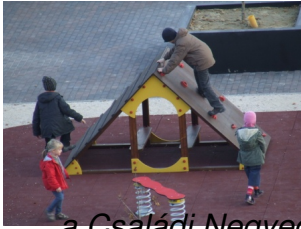
a Családi Negyed játékeit