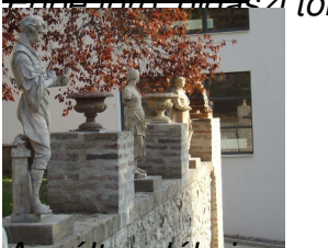
A múlt emlékei