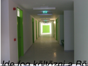
Ide fog költözni a Bölcsészettudományi Kar Szociológia Tanszéke