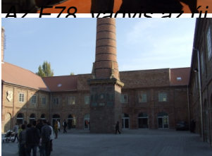
Itt már a következő csoport kezd gyülekezni