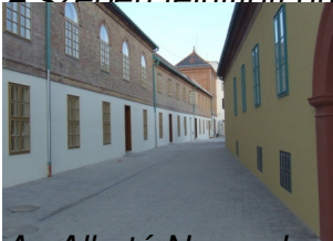
Az Alkotó Negyed egy részlete