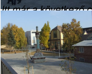
A Pécsi Galéria teraszáról. Ezzel a látvánnyal búcsúztunk a Zsolnay Negyedről