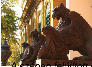
A szépen felújított griffek őrzik a Míves Negyed lépcsőjét