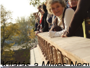
Kilátás a Műves Negyed teraszáról, ami majd az Eozin Kávézó külső része lesz