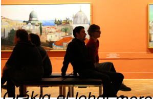
Orákly el lehet merengeni