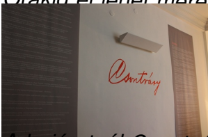
A bejáratnál Csontváry szignója és életrajza köszönti a látogatót