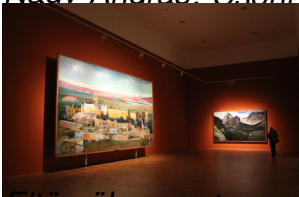
Eltörőül az ember a képek mellett