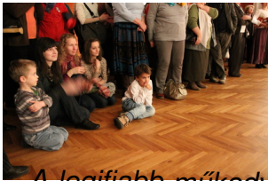
A legifiahból műkedvelő generáció