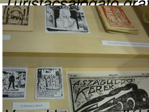
Versekhez, novellákhoz is készített illusztrációkat