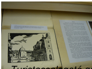
Turistainformató grafika a Széchenyi térről