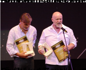
Levegő a kezek között