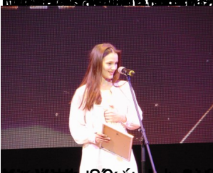
2019-es Magyar Könyvtárosok Díjnyerője: Formabontó 2.0