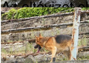
Az eltűnőket vezették