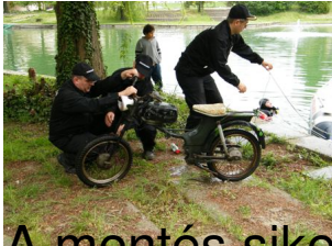
A mentés sikerült