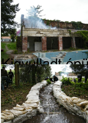
Kiömlődt épületet szimuláltak