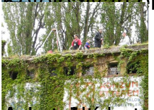
Közvetve engedték le a sérültet