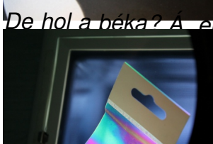
Polarizált fényben is egészen színesek a tárgyaink