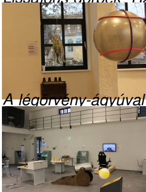
A légorvénny-ágyúval összeborzolhatjuk a béka "haját" és lelőhetjük a poharakat