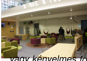
...vagy kényelmes fotelekben