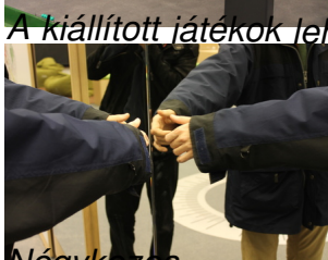
A kiállított játékok lehetőség szerint időről időre cserélődni fognak