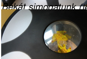
De hol a béka? Á... elbújt ott lent