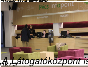
A látogatóközpont is január 21-én nyílik. Innét indulhatunk Zsolnay Negyed-beli barangolás