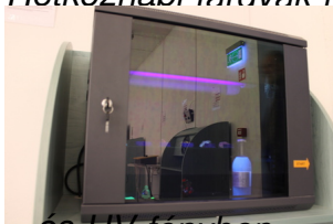
és UV fényben