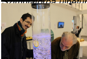
Berebújhatunk a Bermuda-háromszög istenének bőrébe és hajókat süllyeszthetünk el