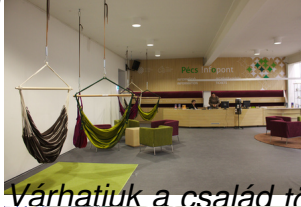
Várhatjuk a család többi tagjait függőágyban...