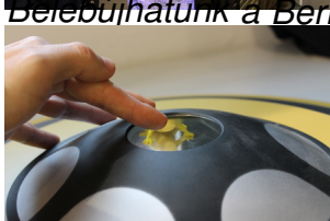
Bekát simogatunk (legalábbis megpróbáljuk)