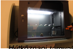
Hétköznapi tárgyak hétköznapi megvilágításban...