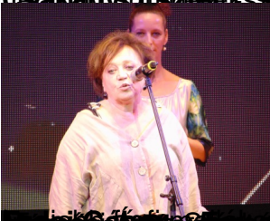
Árnyékok a képek háttér előtt történetet mesél