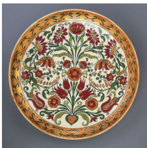
Zsolnay Júlia népies díszítésű tálja

A Zsolnay gyár aranykorának legszebb darabjait bemutató tárlat 2010-es megnyitása óta kilencedik alkalommal bővült. Az új műtárgyakban közös, hogy mindegyik aranybrokát technikával készült fali dísztál. Az aranybrokát eljárás a Zsolnay gyárban az 1880-as évektől terjedt el, a műtárgyak különböző technikával előkészített felületére színarany mázat vittek fel, így a rajzolt minták az arany háttér előtt tűnnek fel.