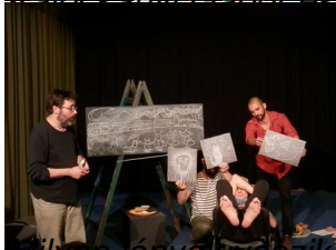
körül a Kéttalpú Embert?