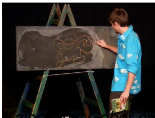
a Majom utazása