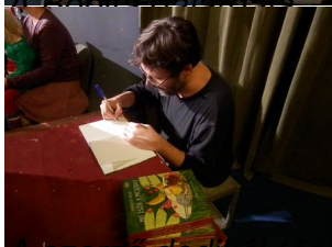
A szerző dedikál (és rajzol)