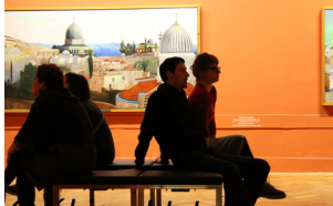
Órákig el lehet merengeni