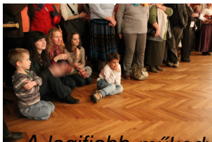
A legifiahból műkedvelő generáció