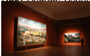
Eltörőül az ember a képek mellett