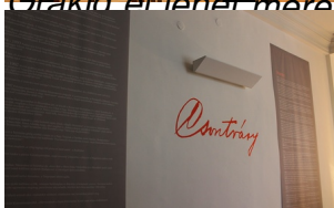
A bejáratnál Csontváry szignója és életrajza köszönti a látogatót