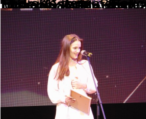
2019-es Magyar Könyvtársági díj díjazottja: Formabontó 2.0