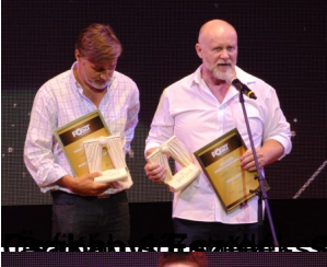
Levegő a kezük között