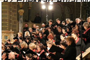
A tíz tételű mű meghallgatása után más szférákban jártunk