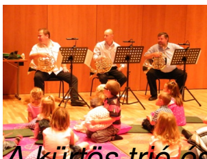
A kürtös trió és az aprónép