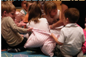
Néha nem árt egy kis pihenés