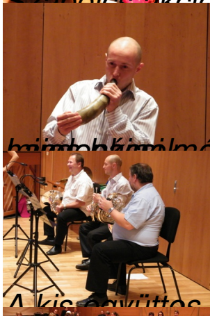
Mihály még tülkön is játszott - egy kis hangszertörténet